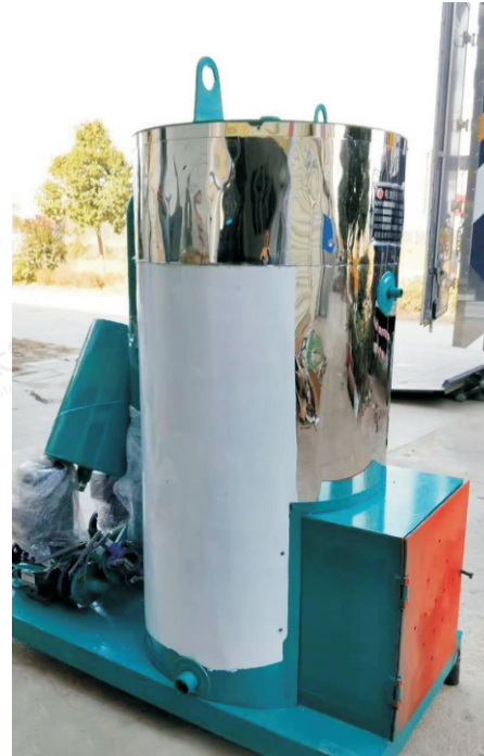
2015.12-0.5吨 CLDR0.35-95/70 河南驻马店市中原大酒店有限公司