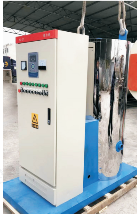
2016.12-1吨 CLDR0.7-95/70 邢台广宗县国家税务局