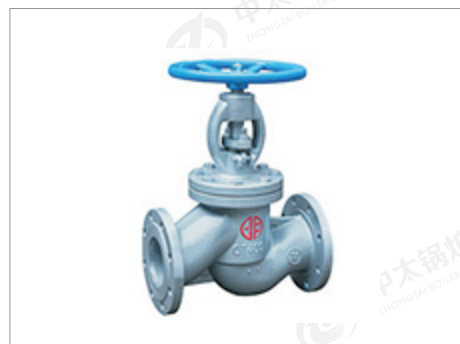
郑州宇明球墨铸铁 截止阀