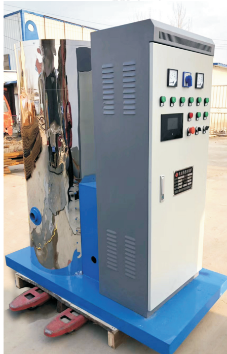
2014.3-0.5吨 CLDR0.35-95/70 河南平顶山红英农业科技有限公司