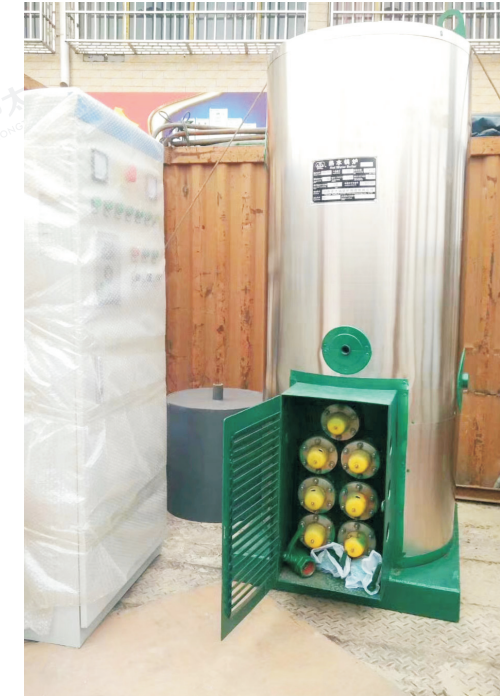
2016.1-0.7吨 LDR0.7-0.7 内蒙古月露食品有限责任公司