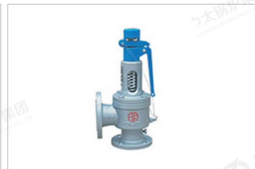
郑州宇明球墨铸铁 弹簧全启式安全阀